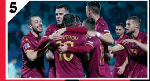
18.11.2024, UEFA Millətlər Liqası Bəlqarıstan - Belarus - 1:1 [Plovdiv, Bəlqarıstan]