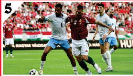
11.06.2024 Belarus - İsrail - 0:4 [Budapeşt, Macarıstan]