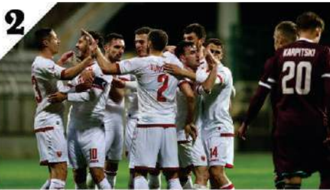
21.03.2024 Monteneqro - Belarus - 2:0 [Antalya, Türkiyə]