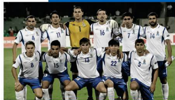
FIFA World Cup 1998 (qualifying round)

T he first football teams in Azerbaijan were created in 1905. At that time, the craving of the English people for oil fields contributed to the development of football. Since England is the birthplace of football, their arrival in Baku made this sport popular among the local population. The first football team in Baku was called the "British Club". Among the teams representing the largest oil companies in Baku, the first official championship, held in Baku in 1911, was won by the "British Club". This team played its first international game in 1912 in Georgia against the local team "Sokol" and won with a score of 4:2..