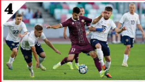
07.06.2024 Belarus - Rusiya - 0:4 [Minsk, Belarus]