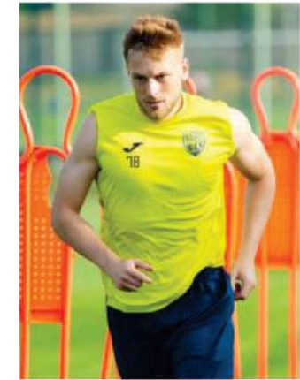
Yeqor Xvalko Kəpəz PFK