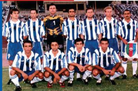
1998 FIFA dünya çempionatı (seçmə mərhələ)

A dıçəkılən komanda ilk beynəlxalq oyununu 1912-ci ildə Gürcüstanda yerli "Sokol" kollektivinə qarşı keçirib və 4:2 hesablı qələbə qazanıb. 1914-cü ildə Bakı Futbol İttifaqı (BFİ) yaransa da, bu təşkilatın ömrü çox sürməyib. 20 komandanı özündə birləşdirən BFİ 1917-ci ildə süquta uğrayıb. 1920-ci ildə futbol yenidən Bakıya qayıdıb və ilk şəhər birinciliyinin qalibi "Sokol" olub. 1926-cı ildə Gürcüstanda təşkil edilən ilk Zaqafqaziya çempionatının qalibi Azərbaycan təmsilçisi "Progress" olub.