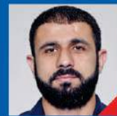
RƏŞAD SADIQOV 111 oyun/games 2001-2017