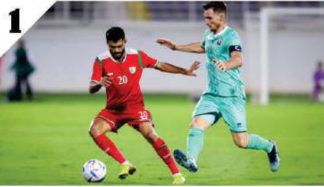
20.11.2022 Oman - Belarus - 2:0 [Əl-Əyn, Birləşmiş Ərəb Əmirlikləri]

Last 5 friendly matches of the Belarusian national team