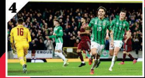
15.11.2024, UEFA Millətlər Liqası Şimali İrlandiya - Belarus - 2:0 [Belfast, Şimali İrlandiya]