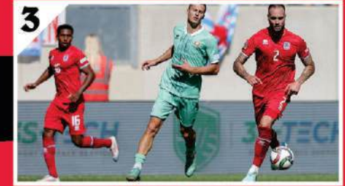
15.10.2024, UEFA Millətlər Liqası Belarus - Lüksemburq - 1:1 [Zaləqerseq, Macarıstan]