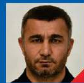
QURBAN QURBANOV 14 qol/goals 1992-2005