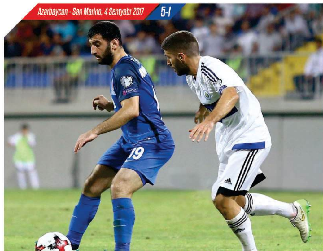
Azərbaycan - San Marino, 4 Sentyabr 2017 5-1

T he first international game of the Azerbaijani national team took place on September 17, 1992 against Georgia. In the match held in Georgia, the home team won with a score of 6-3. Our team's biggest victory was with a difference of 4 goals. Our team beat Liechtenstein 4-0 in 1999 and San Marino 5-1 in 2017. Our team suffered its biggest defeat in 1995 away from France - 0-10.