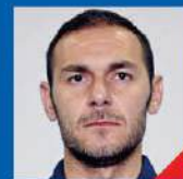
KAMRAN AĞAYEV 79 oyun/games 2008-2018