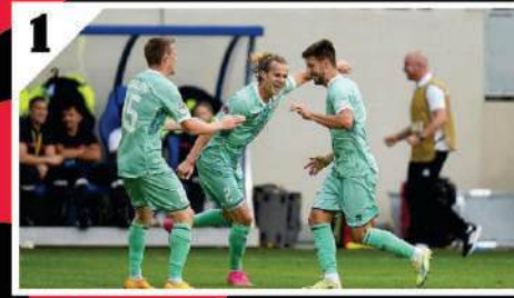
08.09.2024, UEFA Millətlər Liqası Lüksemburq - Belarus - 0:1 [Lüksemburq, Lüksemburq]

The last 5 official games of the Estonia national team