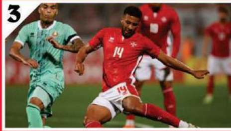
26.03.2024 Malta - Belarus - 0:0 [Ta Qali, Malta]