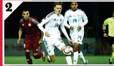
12.10.2024, UEFA Millətlər Liqası Belarus - Şimali İrlandiya - 0:0 [Zaləqerseq, Macarıstan]